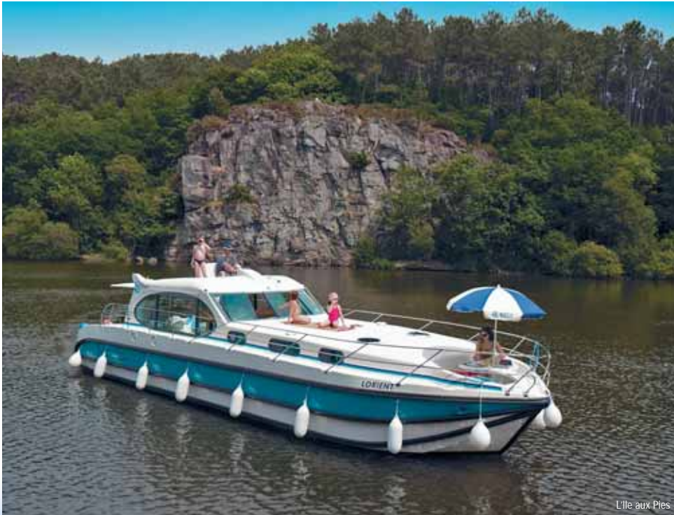
L'île aux Pies