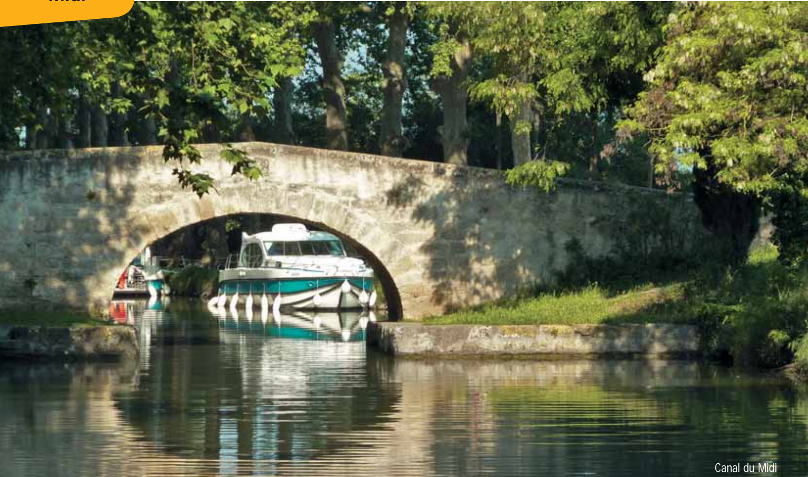
Canal du Midi