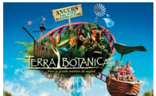
Terra Botanica : gran parque vegetal