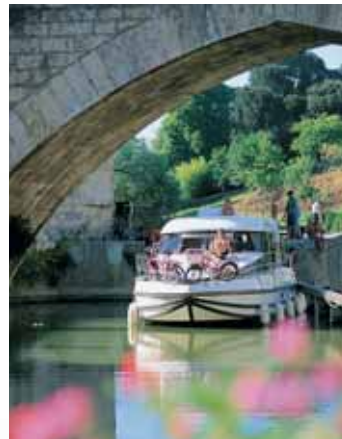
Nérac : Puente-Viejo