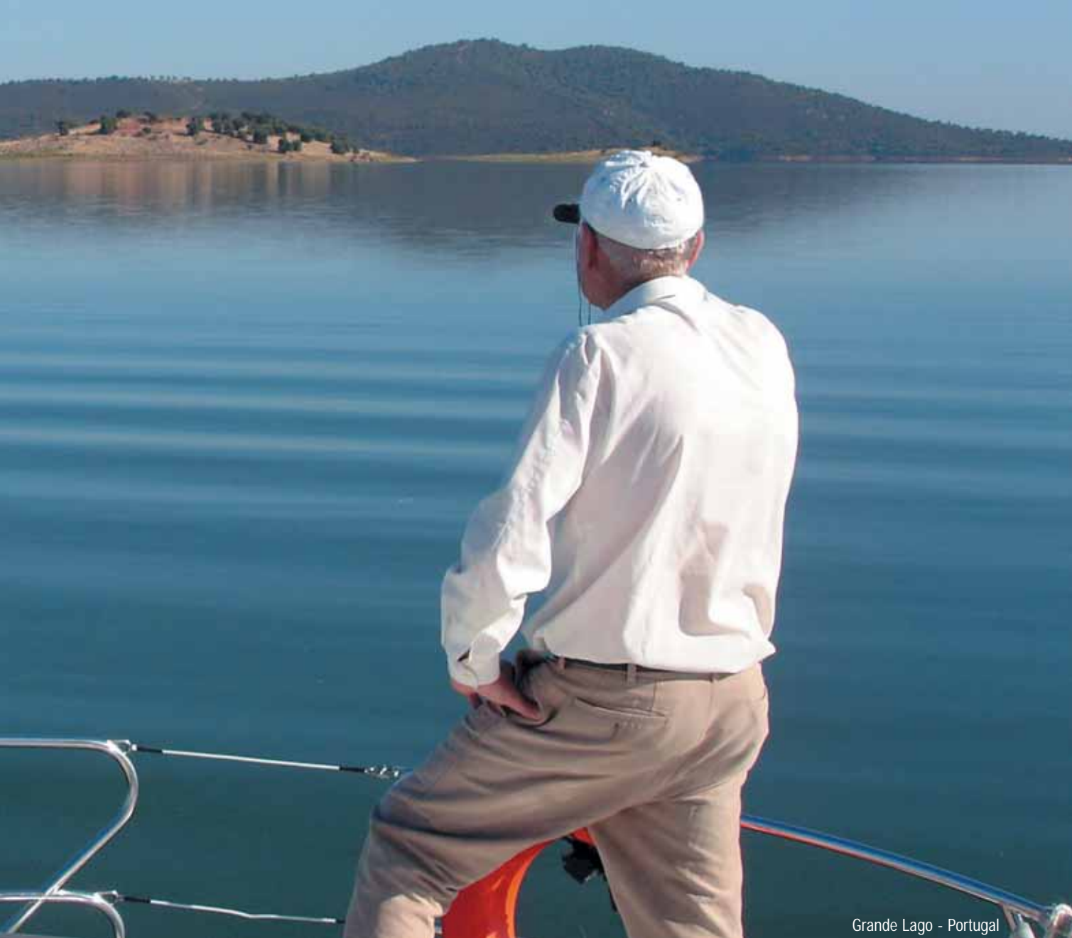
Grande Lago - Portugal