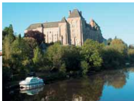
Abadía de Solesmes